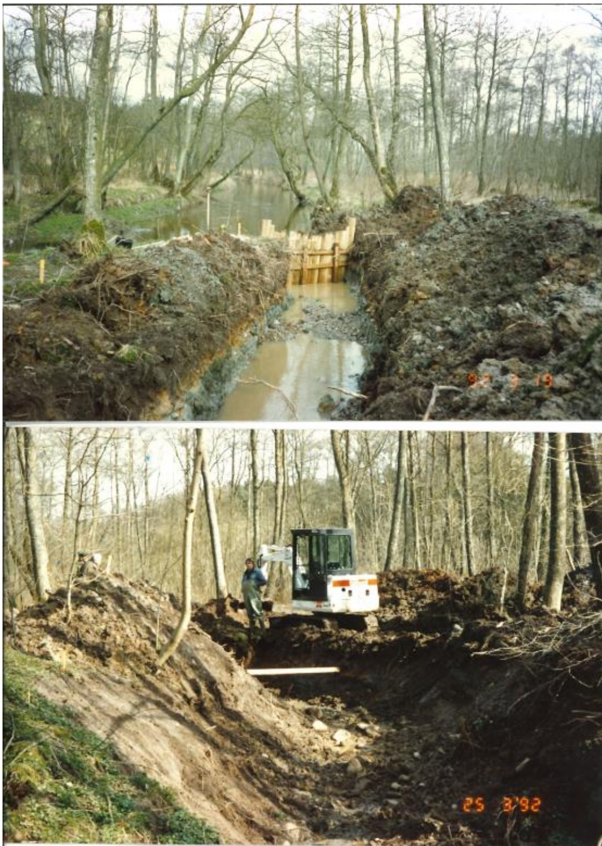
Figur 3: Udgravning af omløb, som etableres tørt under arbejdet.