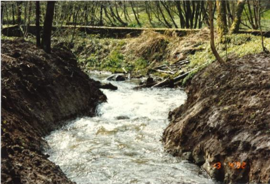
Figur 4: 13. april 1992 er der ført vand ind i omløbet. Det bemærkes, at der ikke er stensat på brinker. Der er tale om dagen forinden, at det er oplyst i vandløbsbogen, at anlægsarbejdet er færdigmeldt.